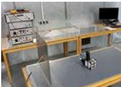
Prüfplatz für leitungsgebundene Tests Test station for line conducted tests