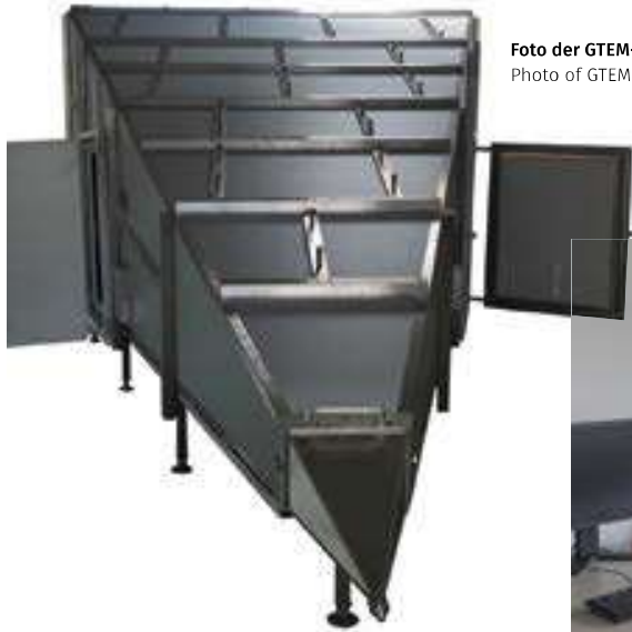
Foto der GTEM-Zelle Photo of GTEM cell