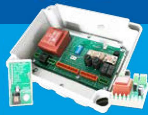
Liftsafe 2 - modular