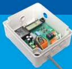
Liftsafe 1 - kompakt